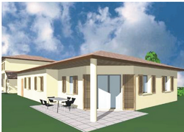
Villa n°2,4,9 T4 A- RDC